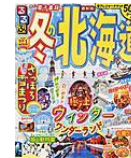
「るるる冬の北海道」 JTBパブリッシング L291 円 冬の北海道をもっと満喫してみませんか!? 旭川や函館などのエリアガイド付き。