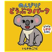
「のんびり! どうぶつパーク」 いしかわ こうじ 作 絵 童心社