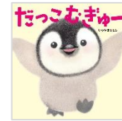
「だっこ むぎゅー」 いりやま さとし 作 絵 KADOKAWA