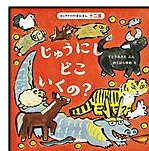
「じゅうにどこいくの?」 すとう あさえ ぶん おくはら ゆめ え ほるぷ出版

昔ながらの遊びには、福を招くものがたくさんあります。それぞれの遊びに願いや厄除けといった意味合いがあります。福笑いには、「笑う門には福来る」と縁起がよいので、お正月にふさわしい遊びとなりました。すごろくは、新年の運試しになりました。親子で楽しんでみませんか。