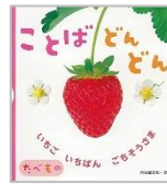
「ことばとどんたべもの」 内田 麟太郎 文 ひかりのくに