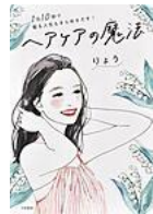
「ヘアケアの魔法」 りょう 著 大和書房 595 円 お金、器用さ、髪質、年齢関係なし。憧れの女性になれる美髪の教科書。10秒からできるヘアケアなども紹介。