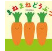
「まねまねどうぶつ」 Shimizu 作・絵 ポプラ社