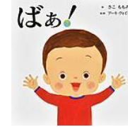
「ばあ!」 さこ ももみ 作 アーキ ヴォイス 監修 マイクロマガジン社