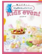
「親子で楽しむ12カ月の キッズイベント」 辰元 草子 著 講談社

さまざまなイベントや行事をパーティにして楽しんでみませんか? 晩秋から冬にかけては、空気が乾燥しているため、月や星空がきれいに見える日が多いです。11月は「宇宙」をパーティテーマに親子で素敵なイベントを過ごしませんか?