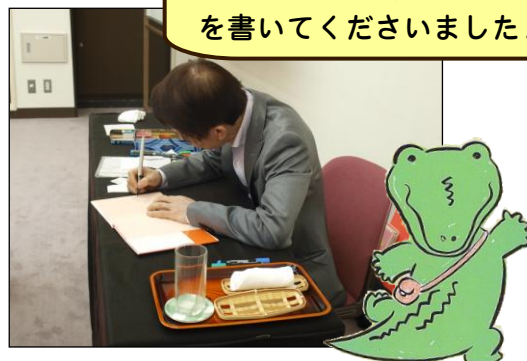
「ハルボンのおでかけ」(アリス館)より