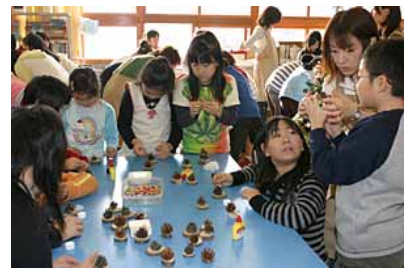
松ぼっくりのツリーづくり