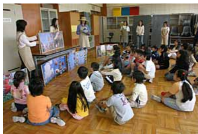
グリーンマザーズの読み聞かせ