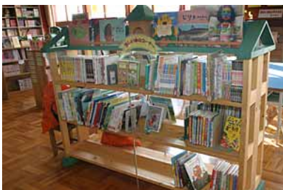
手づくり本棚で図書を紹介